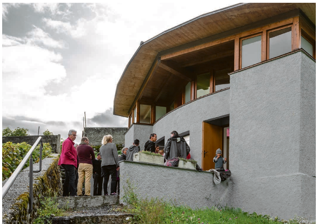
Grande prière de Taizé à la chapelle Annunciata... une idée d'activité en famille?