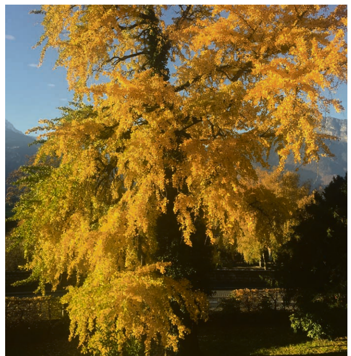
Tout arbre est une parabole de la vie humaine.

Vous avez une recette secrète ou vous aimez juste mettre les mains à la pâte, vous pouvez agrémenter le stand de pâtisseries pour la fête paroissiale ( 10 novembre ) par vos talents. Vos productions peuvent être apportées le samedi depuis 14h et le dimanche dès 9h à la grande salle d'Ollon.