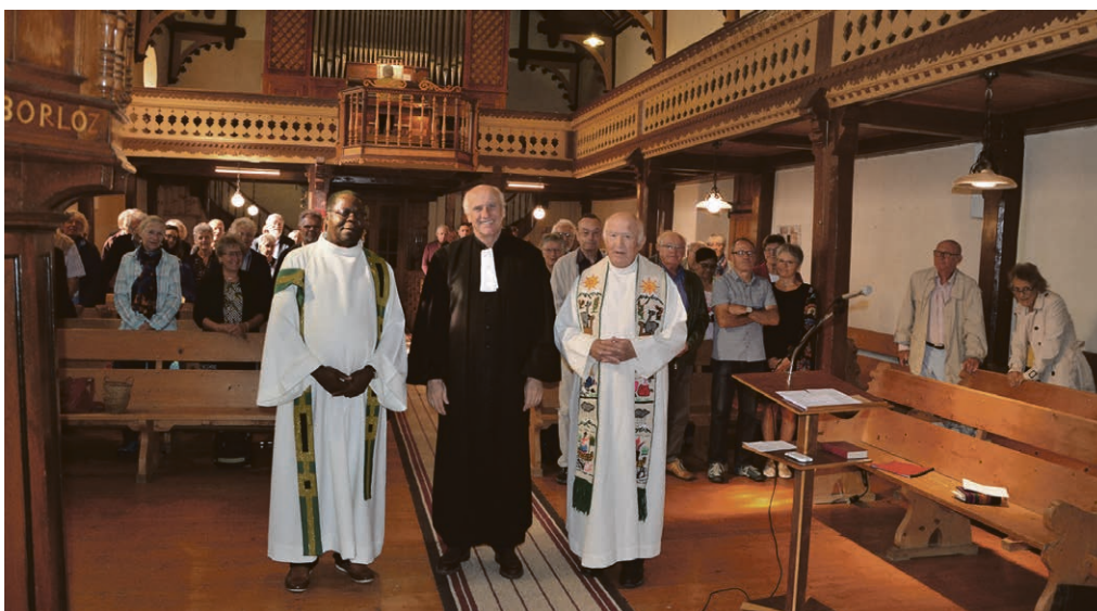
Cergnat service œcuménique 29 septembre.