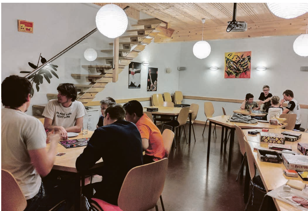
Catéchisme 9-10-11: des soirées jeux animées!

« Souper riz »: chaque fois selon une recette différente et chaque fois en relation avec la campagne d'automne DM-EPER « SILLONS D'ESPOIR ». Occasions de découvrir la collaboration entre la FJKM (Eglise de Jésus-Christ à Madagascar) et DM-échange et mission pour « promouvoir une éducation de qualité dans une approche impliquant tant le corps enseignant et les responsables d'établissement que les élèves, leurs parents et les paroisses locales ». Occasions de découvrir le soutien de l'EPER à des minorités comme les Dalits et les Adivasis systématiquement mises à l'écart de la société. En plus de votre collaboration à la préparation des repas, aux discussions et aux rangements, nous vous attendons pour accueillir des invités de Madagascar et de Suisse. Venez en famille!