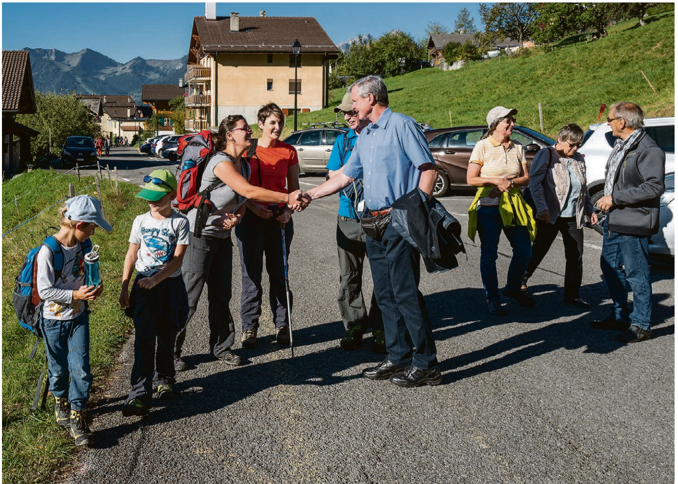
Le 29 septembre, culte rando, à Corbeyrier.

Prochaines dates de JPCV : les JPCV se retrouveront les 1-15-29 novembre et le 13 décembre , pour fêter Noël. Pour en savoir plus, contactez la pasteure Alice Corbaz, 021 331 58 92 ou 078 605 77 09.