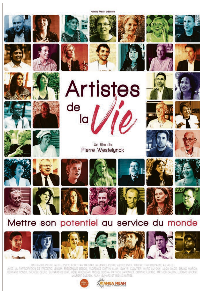
Affiche « Artistes de la Vie ».

Au travers d'une palette de magnifiques témoignages, le film « Artistes de la Vie » nous partage cet élan, cette joie, cet enthousiasme. Après le grand succès de leur film « En quête de sens » (qui ouvrait la voie au film « Demain ») Kamea-Mea revient avec ce film citoyen, engagé, original et positif. Bien plus