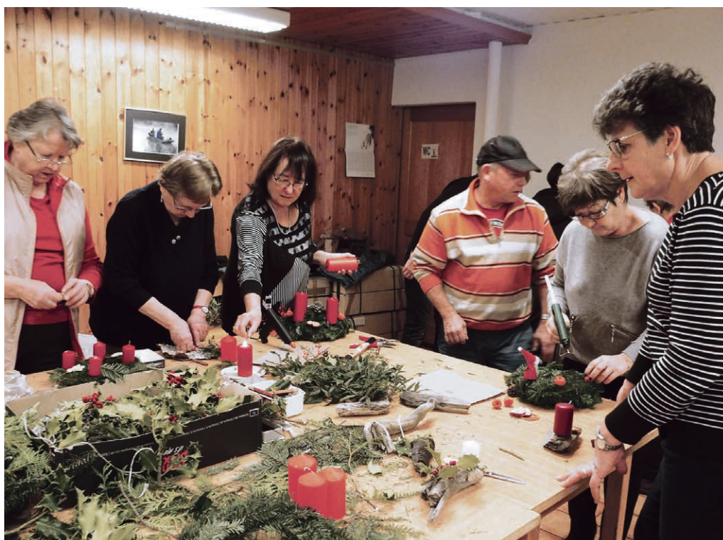
Couronnes de l'Avent, un joli travail à faire ensemble.

Comme les années passées, les paroisses évangélique réformée et catholique, l'Assemblée chrétienne du Haut-Lac ainsi qu'Impact-Chablais se lancent ensemble dans ce beau projet: préparer des paquets de Noël pour enfants ou adultes en Europe de l'Est. Les colis seront rassemblés par canton et acheminés jusqu'à leurs destinataires par les soins de la Mission chrétienne pour les pays de l'Est. Pour un souci d'équité, et pour faciliter le passage des frontières, le contenu de chaque paquet (dans les variantes « enfant » ou « adulte ») répond à une liste précise; vous trouverez ces listes de marchandises et les lieux de dépôts dans notre région sur les papillons déposés dans les différentes églises (renseignements auprès de vos ministres). Si vous n'avez pas la possibilité de faire un paquet, il est possible de donner des marchandises (v. sous Actualités, Collecte de marchandises). L'action se déroule du 1 er au 22 novembre.