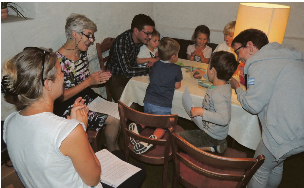
Kids' Club im Schneckenhaus 13.9.2019.